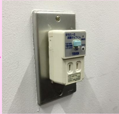
コンセントに挿した状態