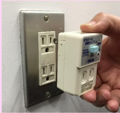
壁のコンセントに挿します