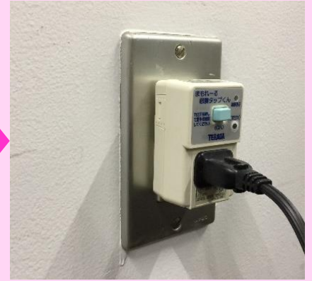
使用する機器の プラグを挿したら完了!